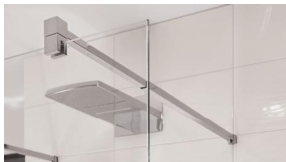
Haltestange Glas/Wand, Teleskop-Funktion